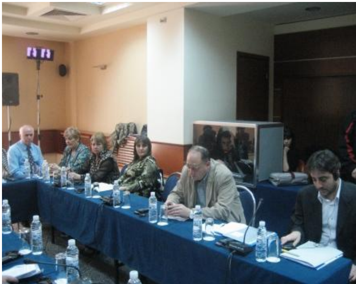
Някои от по-„опитните” български представители в ЕРС на семинар на ELEX в София...

Все още за български синдикални дейци и федерации съществуват информационни празноти – например дали гръцките компании инвестиращи в България имат ЕРС, как да бъде намарена информация за конкретни компании от конкретни страни и т.н. Един от изводите при работата по проекта ELEX е, че в тези случаи е необходимо мобилизирането на различни канали – конфедерации или федерации в съответната страна, европейски или международни федерации, неправителствени организации, работещи в тази област (като участниците в проекта).